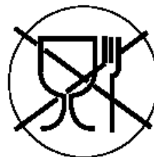
Рисунок 1 для пищевой продукции